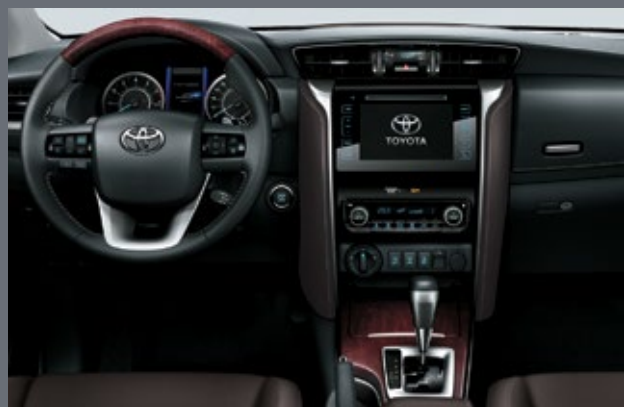
Современный и комфортный интерьер