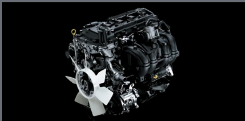
Современный бензиновый или дизельный двигатели