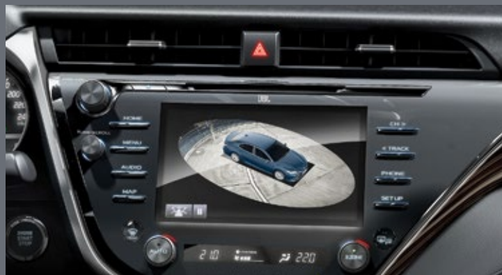
Система кругового обзора 360°