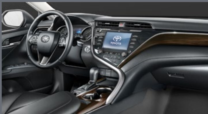
Качественно новый интерьер